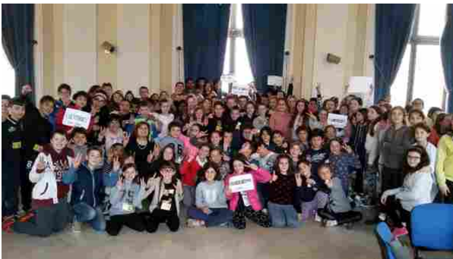
Foto di gruppo delle squadre finaliste per la Scuola Primaria

"Beatleslettori" e "Il più grande spettacolo dopo il Big Bang" , Chiari e Gussago: sono loro i campionissimi della quattordicesima edizione di Storie per Gioco, la gara di lettura del Sistema Bibliotecario Sud Ovest Bresciano.