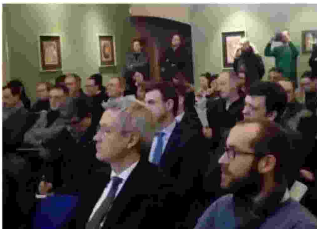
Il pubblico che ha seguito la presentazione della ricerca

tato da tanti aspetti positivi, dovrebbe fare di più per la lotta ai tumori, per aumentare il numero dei diplomati e laureati, per sviluppare la cultura, per ridurre la cementificazione del territorio. Problemi che superano i confini amministrativi e che i comuni dovrebbero affrontare in un'ottica di condivisione e partecipazione. Motivazioni, metodologie ed esiti dello studio sono stati presentati ieri nel castello San Giorgio di Orzinuovi da Maria Pia Sorvillo, dirigente nazionale dell'Istat, che ha stilato una sintesi dei 130 indicatori utili a definire cosa sia il benessere per la società contemporanea, e da Francesco Mazzetti, dell'Università degli studi di Brescia. •