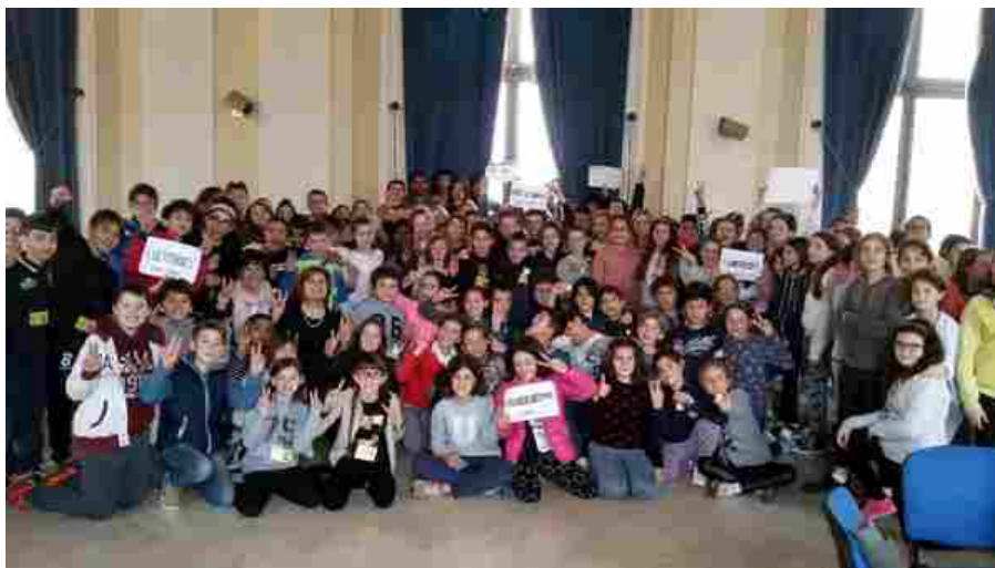
Foto di gruppo delle squadre finaliste per la Scuola Primaria

"Beatleslettori" e "Il più grande spettacolo dopo il Big Bang", Chiari e Gussago: sono loro i campionissimi della quattordicesima edizione di Storie per Gioco, la gara di lettura del Sistema Bibliotecario Sud Ovest Bresciano.