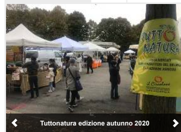
Tuttonatura edizione autunno 2020